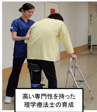
高い専門性を持った 理学療法士の育成