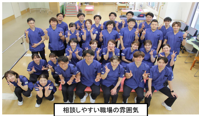
相談しやすい職場の雰囲気